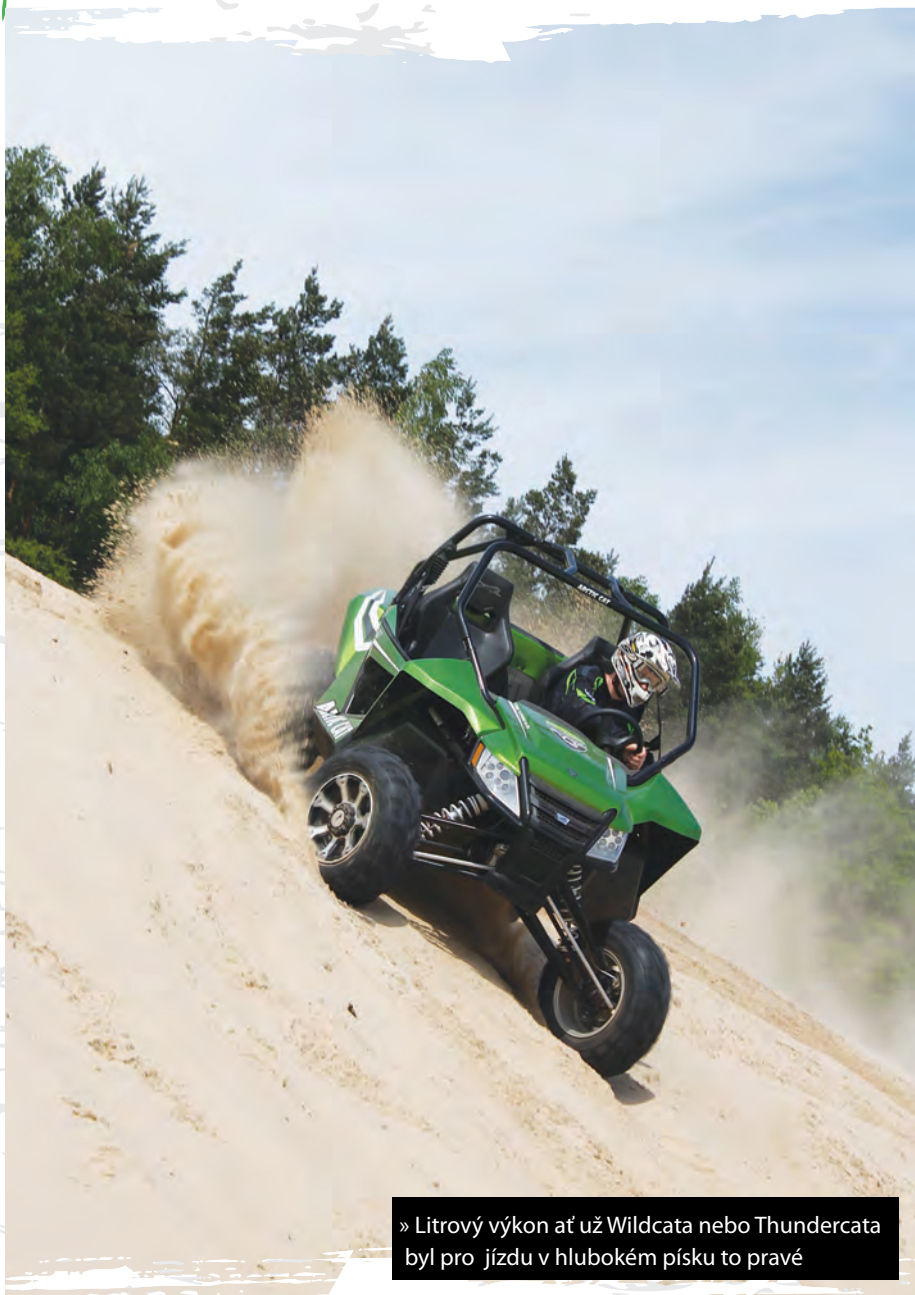
» Litrový výkon ať už Wildcata nebo Thundercata byl pro jízdu v hlubokém písku to pravé

Bonusem jsou tu rozsáhlé oblasti písčitých plání, které připomínají téměř pouště, a proto tu na některých místech jezdí trénovat i polská dakarská reprezentace.