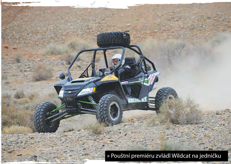
» Pouštní premiéru zvládl Wildcat na jedničku