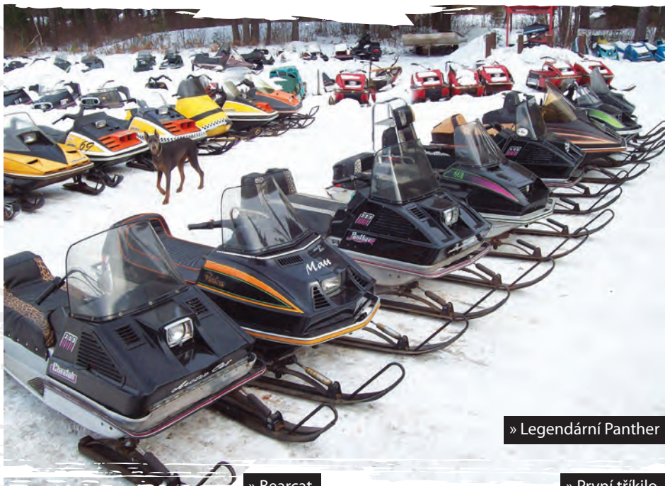
» Legendární Panther