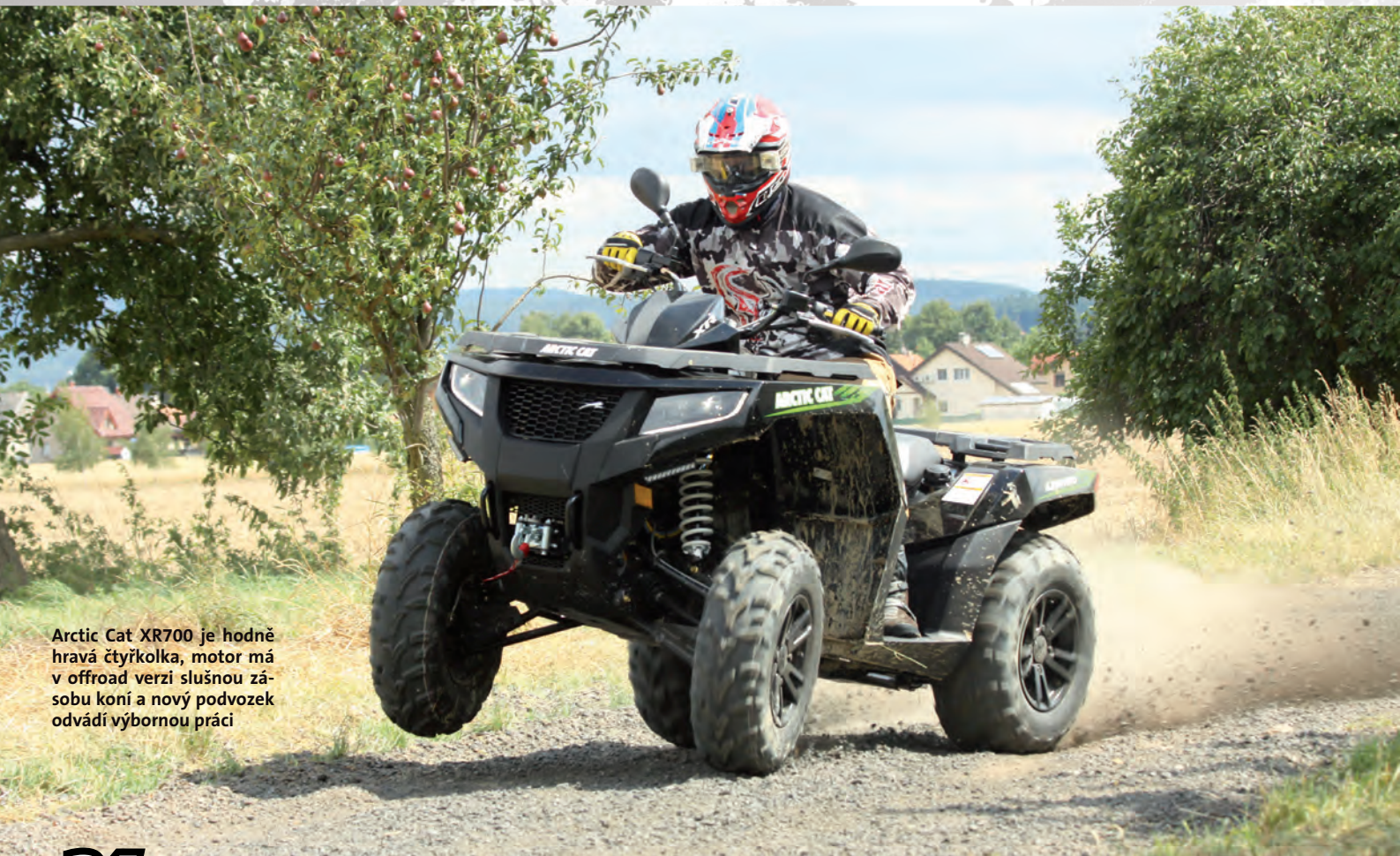
Arctic Cat XR700 je hodně hravá čtyřkolka, motor má v offroad verzi slušnou zásluhu koní a nový podvozek odvádí výbornou práci