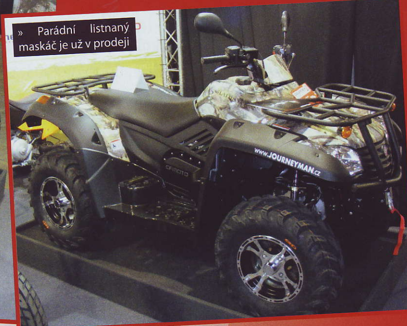
» Parádní listnaný maskáč je už v prodeji