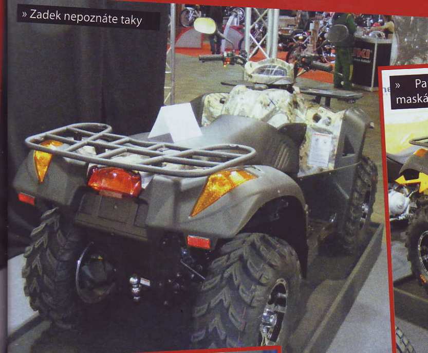
» Zadek nepoznáte taky