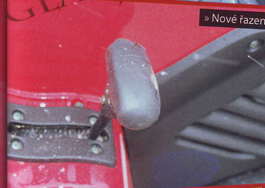
» Nové řazení