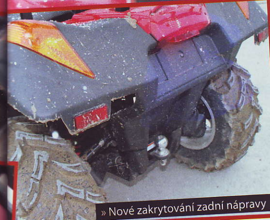
» Nové zakrytování zadní nápravy

šeném šasi. Technika je až na drobnosti shodná s poslední generací 530 a tím je řečeno prakticky vše. Abychom si to tedy pro nově přichodící zopakovali, vezmeme to rychle: Gladiator je vcelku masivní užitková čtyřkolka inspirovaná kdysi technikou Yamahy, která ovšem prošla vývojem, i za přispění českého importu. Už pěkně dlouho používá trvanlivý dvouventilový jednoválec s objemem 493 ccm, který v otevřené variantě dává výkon 35 koní a točivý moment 40 Nm. Směs mu chystá osvědčený karbec Mikuni. Tenhle pohon vystačí Gladiatorovi při zařazeném H asi tak na devadesátikilometrovou rychlost. Kromě toho má převodovka ještě redukci, neutrál, zpátečku a parkovačku. Standardně je Glad vybaven elektricky připínatelným pohonem předních kol i uzávěrkou předního diferenciálu.