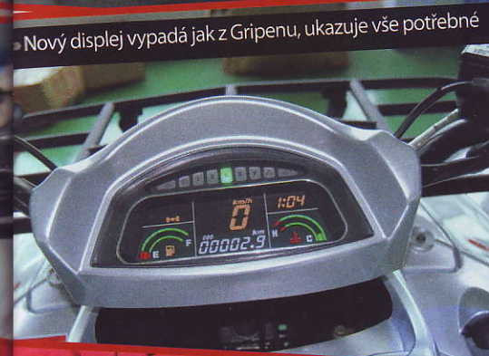
» Nový displej vypadá jak z Gripenů, ukazuje vše potřebné