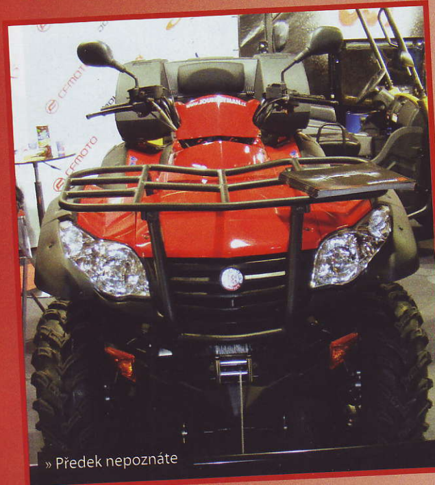
» Předek nepoznáte

Už loni si technika původem od CF Mota vysloužila jiné kapoty, aby šla mašina víc s dobou, a i když čtyřkolka zrovna nepodléhá módním trendům tak rychle jako motorky, tak po roce je tu proměna další, tentokrát o poznání důkladnější. Po Gladiatorovi 510 a 530 je tu tentokrát Gladiator X5. I když ani minulá označení neměla úplně přímou souvislost s velikostí motoru, tak jste při jejich přečtení mohli vytušit objem kolem půl litru, nebylo to nikdy 510 ani později 530 kubiků, teď je to taky pořád stejně a aspoň se nikdo nebude dohadovat, jestli náhodou