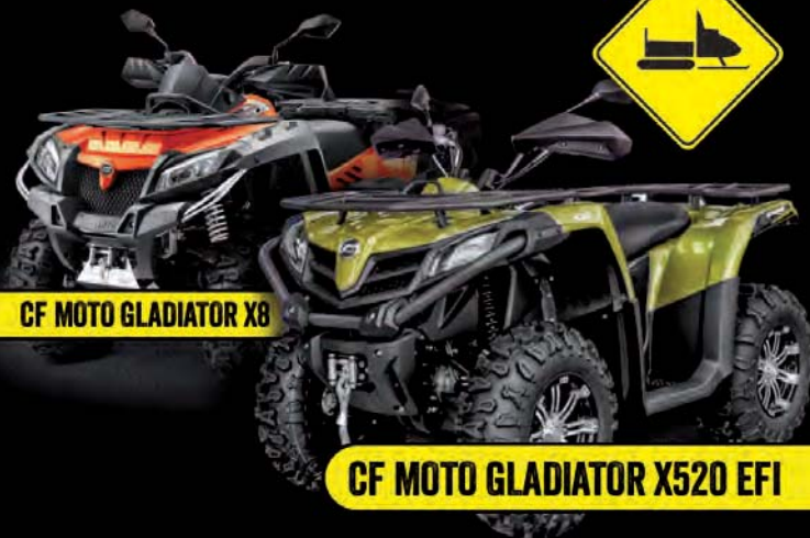
CF MOTO GLADIATOR X8