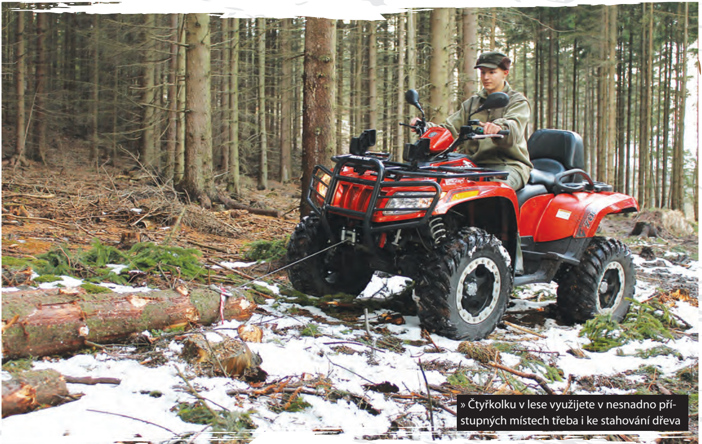
» Čtyřkolku v lese využijete v nesnadno přístupných místech třeba i ke stahování dřeva

Čtyřkolku v českých luzích a hájích berou lidi většinou jako prostředek zábavní a tak jí i v drtivé většině případů všichni používají. A i proto se na nás nečtyřkolkáři koukají skrz prsty... Jenže, ne nadarmo se čtyřkolky dělí na sportovní a pracovní. PRACOVNÍ! Pracovní tedy neznamená jenom to, že tam máte 4x4, nebo že to má nosiče, kam se dá přikurtovat batoh a gril, když jedete na výlet. Jako pracovní stroj totiž má čtyřkolka sloužit profesionálům ve výkonu jejich práce či zaměstnání a zhodnocovat tak investici do ní vloženou při koupi. Ne jenom jí bezúčelně ojíždět při blbnutí.