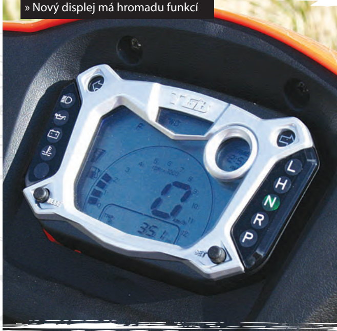
» Nový displej má hromadu funkcí