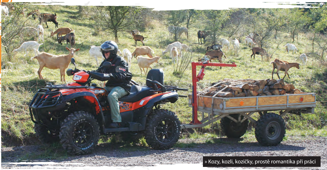
» Kozy, kozli, kozičky, prostě romantika při práci