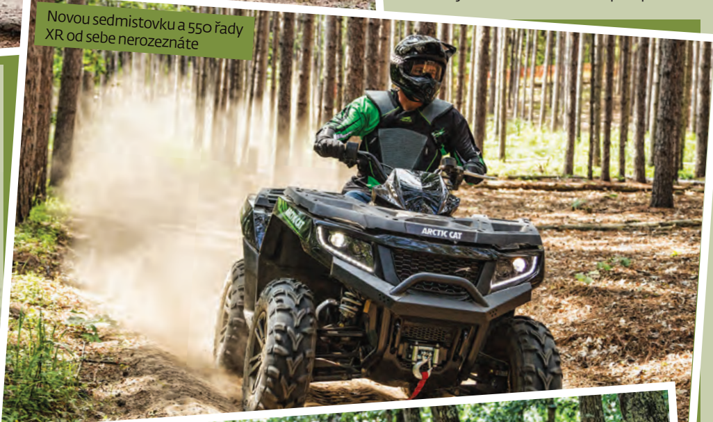
Novou sedmistovku a 550 řady XR od sebe nerozeznáte

z Wildcata tu pořád ještě nenajdete... Nové modely tedy mají před číslovkou písmena XR. Že jde o úplně nové modely a ne jen o nějaký facelift, svědčí šasi s prodluženým rozvorem náprav, který je nově 52 palců (1320 mm) místo dřívějších padesáti, mašiny jsou ovšem celkově o víc než palec kratší. S tím souvisí nová pozice jezdce, kdy nohy na nášlapech budou blíže k sobě (střed stroje je o cca 5 cm užší), motor tu je navíc posunutý dopředu, takže nášlapy jsou i delší o cca 7,5 cm. Jak moc jsou kolký přepracované, dokládá i přesunutí airboxu sání do prostoru pod sedačku. Tam je líp dostupný a má nově kulatý filtr s papírovou vložkou obalený tka-