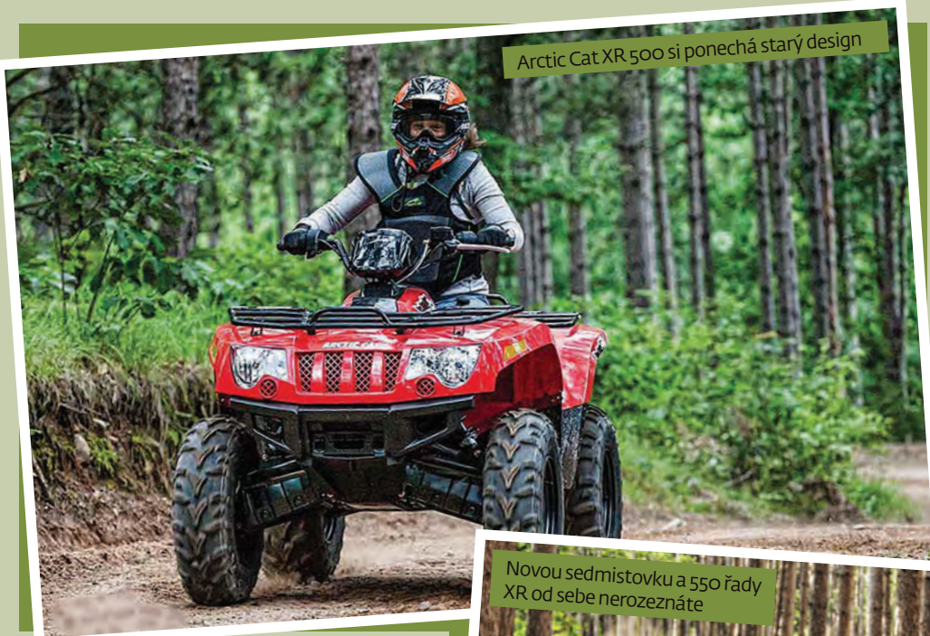
Arctic Cat XR 500 si ponechá starý design

vidovaný je i zadní lichoběžník, což má za následek delší zdvih kol. Posilovač se bude dodávat k 550 a sedmistovce, ty se od pětikila výrazně designově liší a na rozdíl od něj mají třeba nové pogumované plotny s upínacím systémem Speed Rack II místo tradičních trubkových nosičů, u kterých pětikilo zůstává. V pohonu by moc novinek být nemělo – Arctic Cat uvádí doladěný systém vstřikování a nový katalyzátor, což má ve výsledku přinést poměrně zásadní 25procentní úsporu paliva.