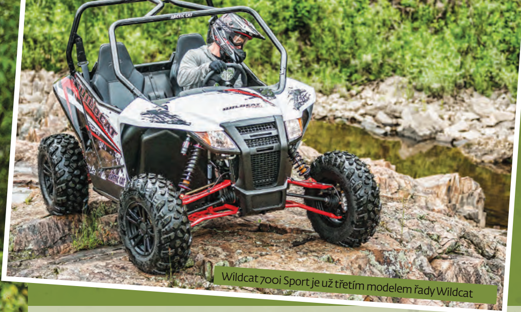
Wildcat 700i Sport je už třetím modelem řady Wildcat

kapotkou, kam nasoukáte pár nezbytností na cestu.