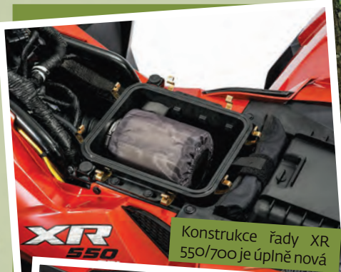
Konstrukce řady XR 550/700 je úplně nová