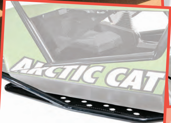
TEXT: Dep