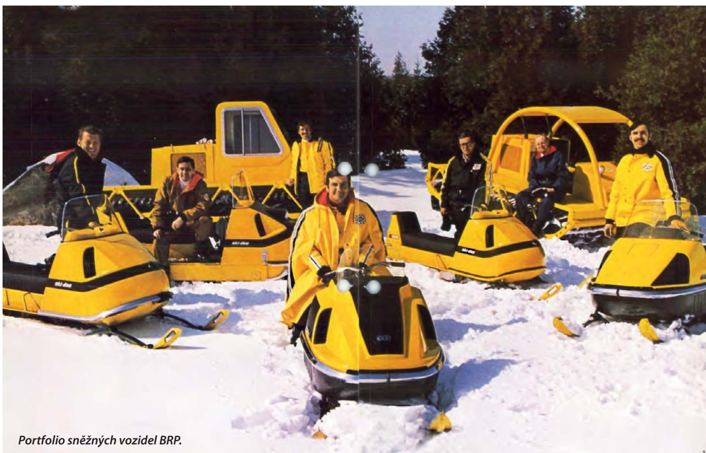
Portfolio sněžných vozidel BRP.

Ski-Doo – sněžné skútry, Sea-Doo – vodní skútry a lodě, Lynx – pracovní sněžné skútry, Envirude – lodní motory a Rotax – motory pro motorky, čtyřkolky, vodní a sněžné skútry, ale také motokáry a malá letadla. Mimochodem ještě je tu společnost Bombardier, která vyrábí velká letadla od business jetů až po dopravní letouny pro střední trasy a kolejové dopravní prostředky od vysokorychlostních vlaků po tramvaje.