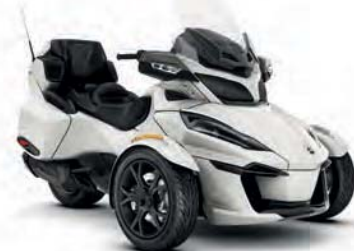
Can-am Spyder RT