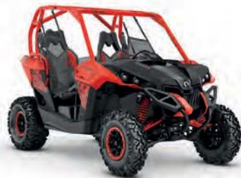
Revoluční Can-am Maverick