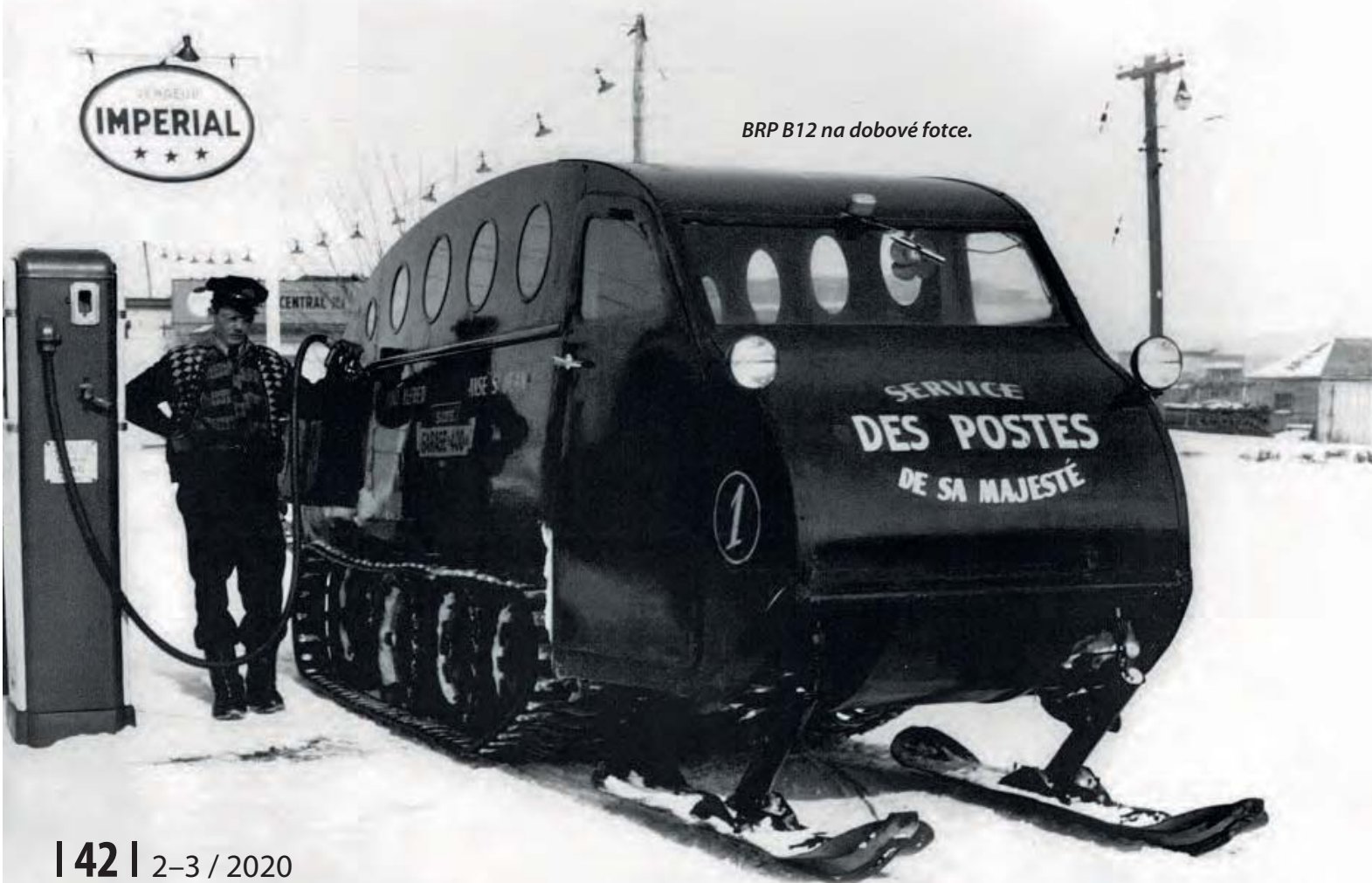
BRP B12 na dobové fotce.

v Mexiku (čtyřkolky), Finsku (sněžné skútry) a Rakousku (motory Rotax). Její produkty se prodávají ve více než sto zemích. Aktuálně patří do koncernu BRP značky Can-Am motorcycles – čtyřkolky, tříkolky Spyder a Ryker,