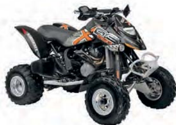
Can-am DS650 Baja