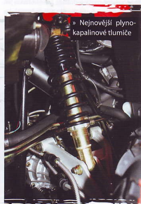
» Nejnovější hydro-pneumatické tlumiče