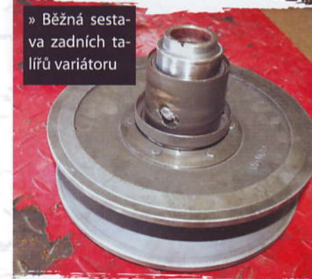
» Běžná sestava zadních talířů variátoru

Když už si tak toho svého Gladiatora sestavujete na míru, tak máte kromě barev, délky, kol, gum a dalšího i jiné možnosti. Můžete si hned