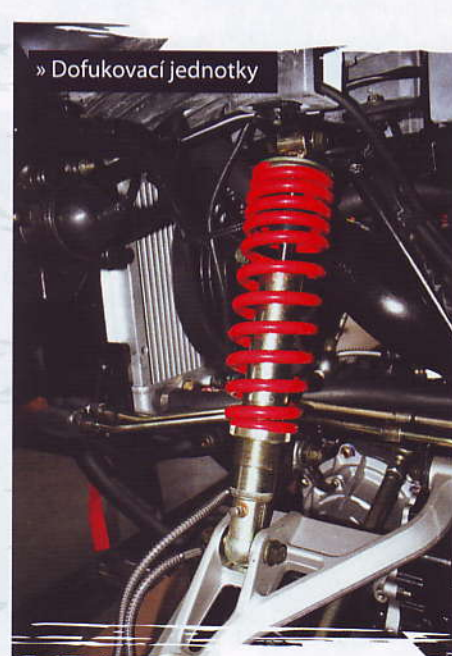
» Dofukovací jednotky