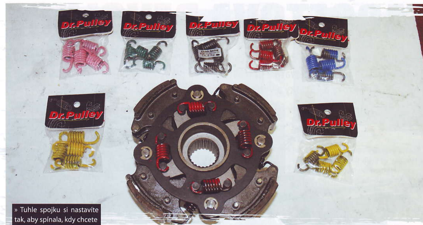
» Tuhle spojku si nastavíte tak, aby spínala, kdy chcete

i při celodenním náročném provozu. Osobně bych si je vybral.