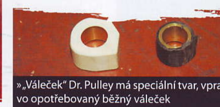
» „Váleček“ Dr. Pulley má speciální tvar, vpravo opotřebovaný běžný váleček

Další možností ladění je výměna sekundární sestavy variátoru (talíře s pružinou) za tuningovou od kanadské firmy CVTech. V tomhle případě jde o vylepšení vlastností mašiny při brzdění, kdy tradiční systém při zabrzděné zadní nápravě nedokáže rychle dopnout řemen a tím dochází při opětovném přidání k prodlevám, proklouznutí a pískání řemenu. To řeší vyfoceny systém s dvojitou křivkou posuvu talíře. Běžně