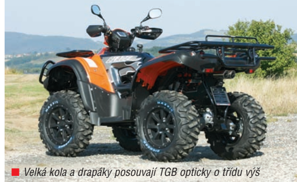
■ Velká kola a drapáky posouvají TGB opticky o třídu výš

Oproti Bladeovi se čtyřtápatadesátkou má půllitr rozšířený rozchod pro větší průchodnost terénem, a naopak převzat je například účinný systém brzdění motorem. Ovládání variátoru umožňuje i řazení redukce a zatímco vpředu jsou kotouče dva, vzadu je jen jeden, ale pro zjednodušení umístěný přímo na hřídeli kardanu. Na pracáku je několik pěkně zpracovaných detailů a můžeme začít třeba u palubky. Ta se skládá z jednoho velkého displeje, kolem něj dvě řady kontrolky, na něm velké číslice tachometru, dobře viditelný ukazatel stavu paliva a do toho digitální otáčkoměr se stupnicí po obvodu budíku. Pod tachometrem zbylo místo pro další čísla a přepínací páky mezi ukazateli ujetých kilometrů, otáčkami nebo průměrnou rychlostí. Pětistovka sedí na velkých docela vysoko a ani při popisu ostatních rozměrů není na místě používat slova jako malý nebo poddimenzovaný. Výhodou mašiny je robustnost, dobrá prostupnost terénem, spolehlivé brzdy a dost prostoru pro řidiče. Konstrukce Bladea je na dobré úrovni, technika je stavěná na středně těžkou práci a vedle toho i na výlety, když je práce hotová. Nebo spíš hlavně to, práce může být použita klidně jako záminka pro obhájení nákupu a čtyřkolku můžete používat na jakkoli dlouhé výlety po přírodě, jak je rok dlouhý. K úplnému štěstí chybí potom už jen navigák, se kterým se nemusíte bát jakéhokoli terénního dobrodružství.