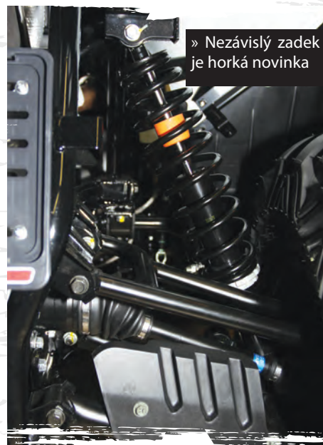
» Nezávislý zadek je horká novinka

T arget od TGB nikdy nebyla čistokrevná sportovní čtyřkolka. Výrobce využil platformu, na které staví i vyložené užitkové Blada, a vytvořil mašinu, která zkombinovala pohon všech kol, tuhou zadní nápravu a sportovní design s agresivní maskou. Unikátem tu pak bylo místo očekávaných tří hned šest pružin a tlumičů, díky kterým si tuhle čtyřkolku s ničím jiným nespletete.