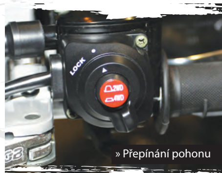
» Přepínání pohonu